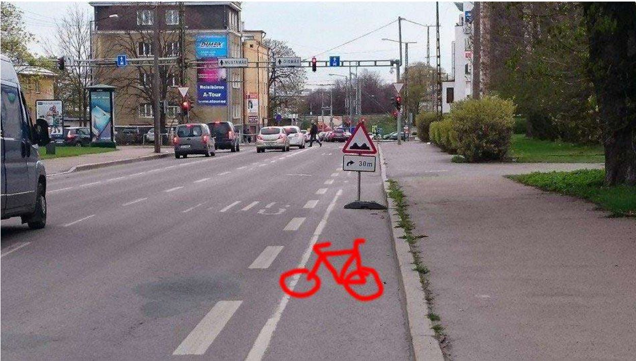
Endla tn, Tallinn.

KUI INIMENE TAHAB JA SUUDAB ÕPPIDA VÕI TÖÖTADA, AGA TEDA TAKISTAVAD TEMAST ENDAST MITTE OLENEVAD ASJAOLUD , SIIS NEED TAKISTUSED TULEB KÕRVALDADA.