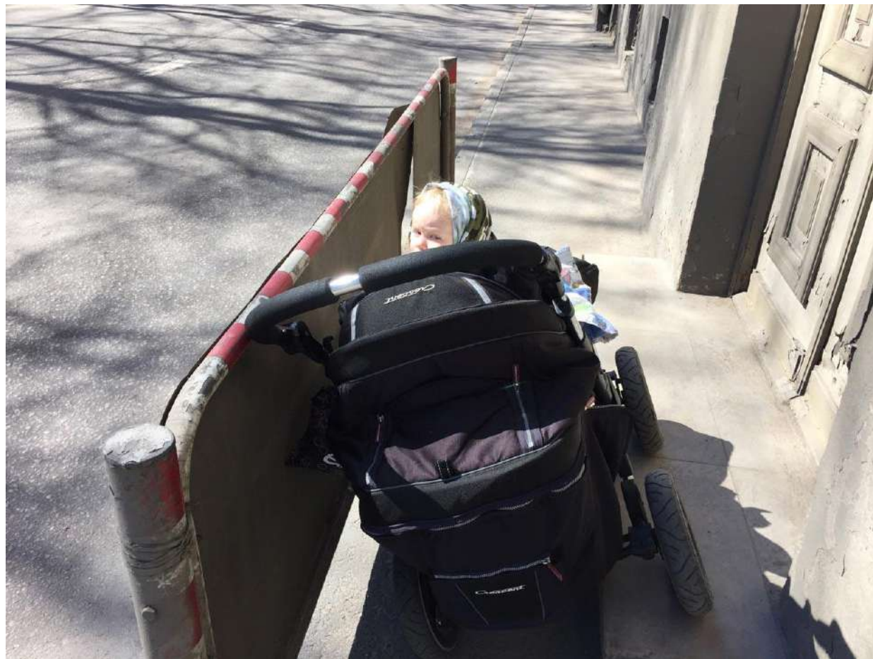
Põhja pst, Tallinn.